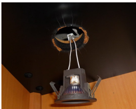
Juwelier (in seiner Ausstellungsvitrine)